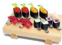
Spojujeme internet a Sushi